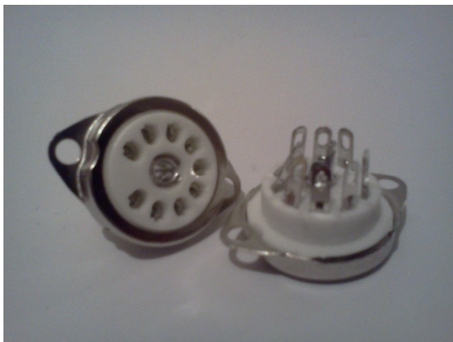
Панель ламповая (ПЛК-9)