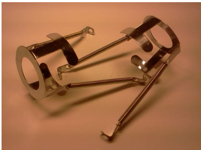
Скоба прижимная для EL34