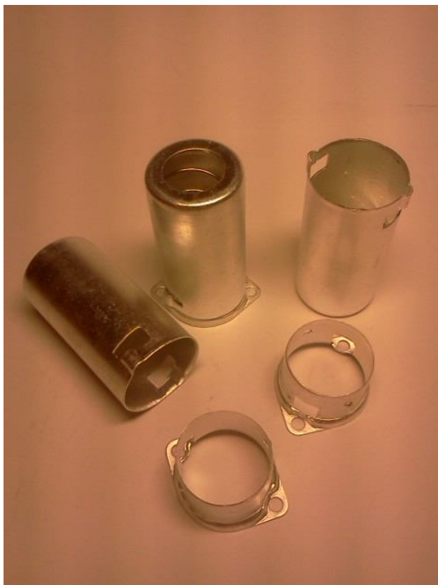
Экран для ПЛК-9(55 мм)