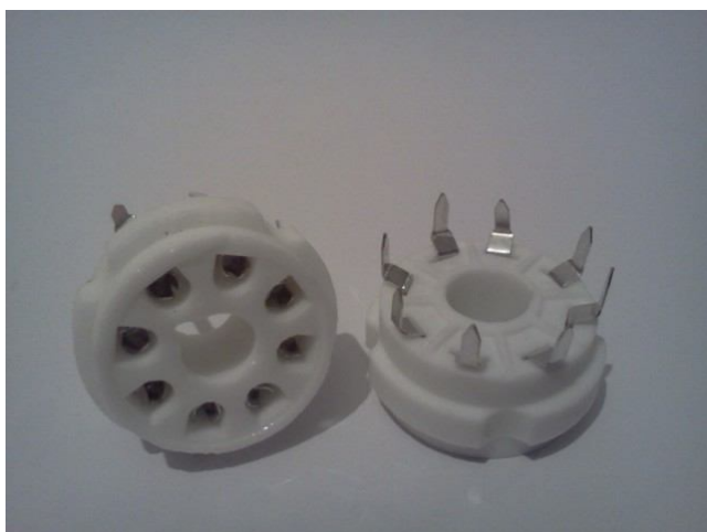
Панель ламповая для монтажа на печатную плату(октальный цоколь)