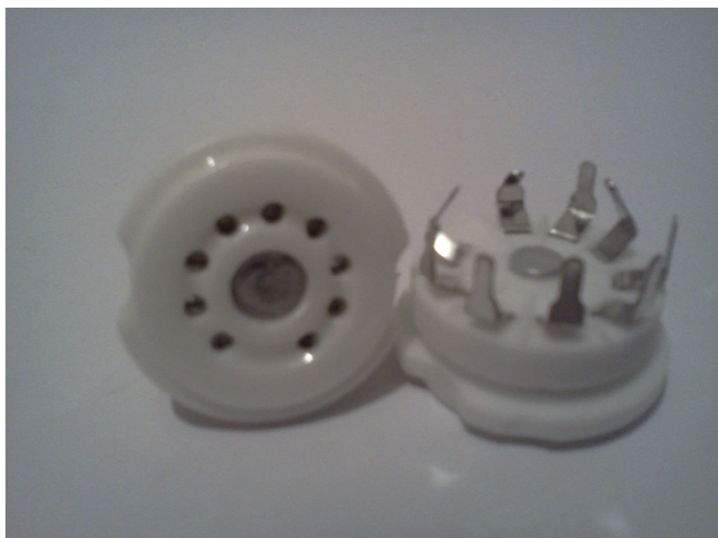
Панель ламповая(6Н2П, 12АХ7) для монтажа на печатную плату