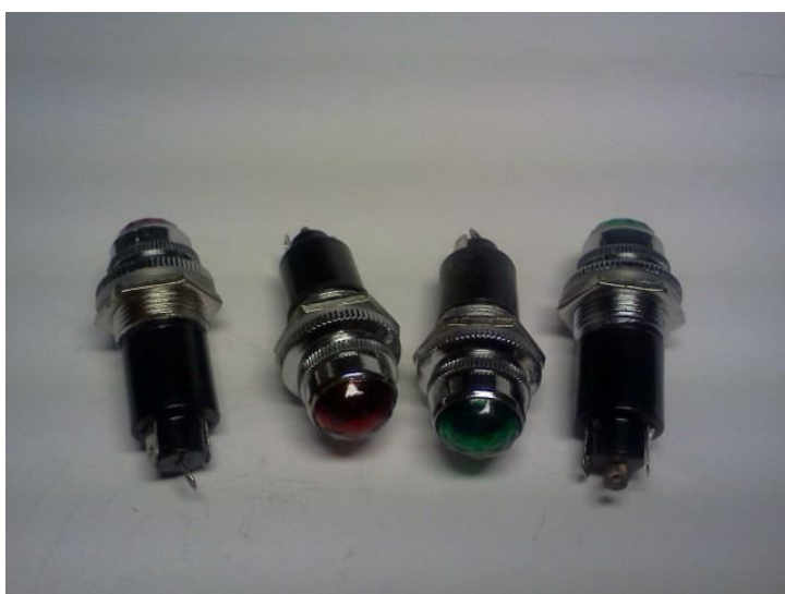
Цена 9 грн