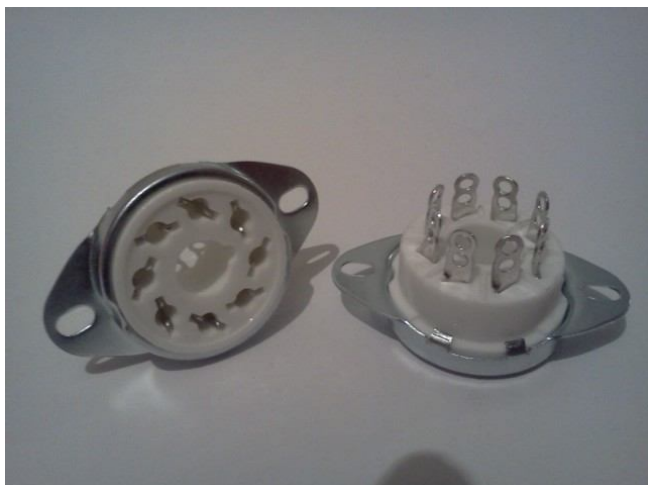
Панель ламповая(октальный цоколь)