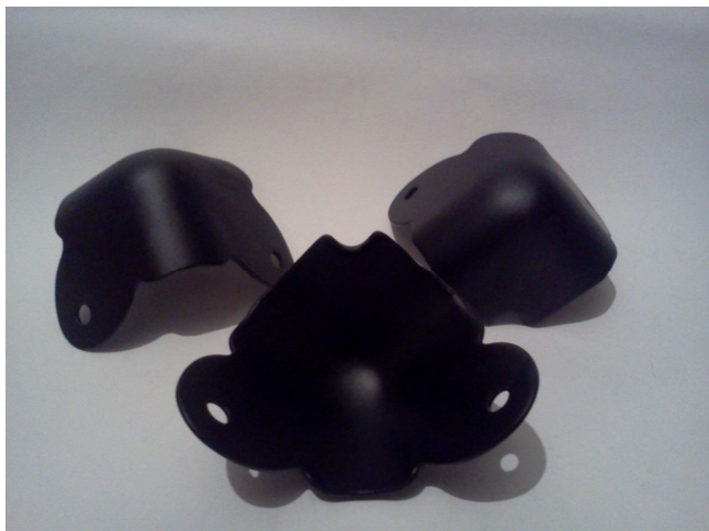
Цена 10 грн