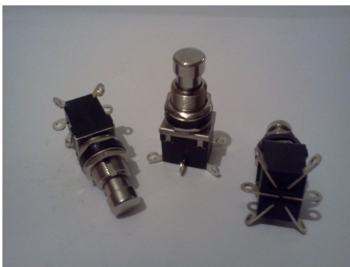
Цена 28 грн