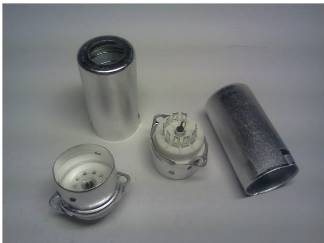
Панель ламповая с экраном(ПЛК-9Э-55)