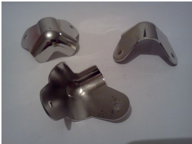
Цена 10 грн