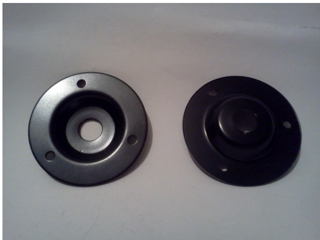
Цена 10 грн