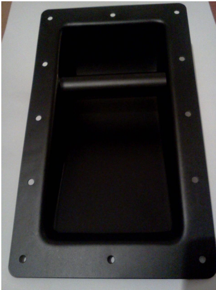
Цена 60 грн/шт