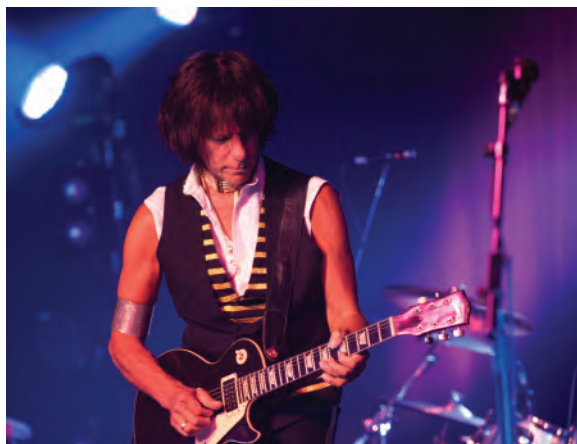
How High Is The Moon – «дуэт» с Лесом Полом