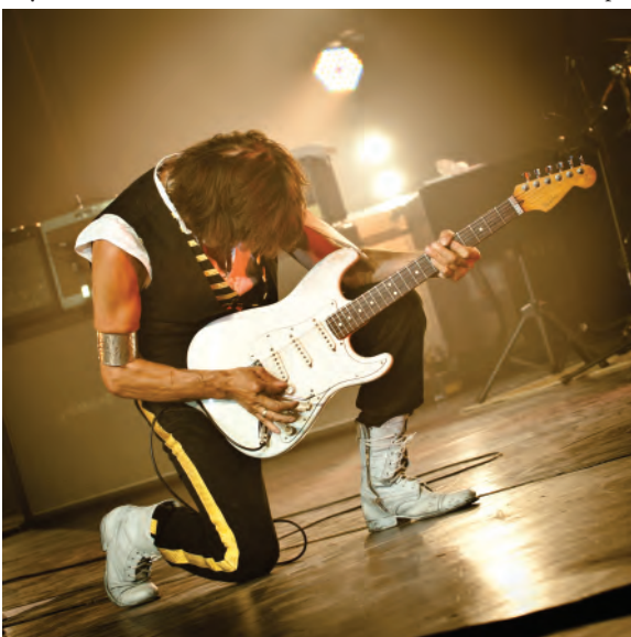
Финальный аккорд концерта

А дальше был концерт... Джефф Бекк приятно порадовал – я ожидал услышать стандартный британский «тяжелая», а программа Бекка была гораздо разнообразней стилистически: звучали композиции и в стиле фьюжн, и фанки, и даже нечто вроде психоделического прогрессива в духе Фрэнка Заппы, а в конце в качестве сюрприза прозвучал джазовый стандарт How High Is The Moon . Это был необычный номер, который Джефф Бекк посвятил памяти великого изобретателя и музыканта Леса Пола. Для исполнения этого номера