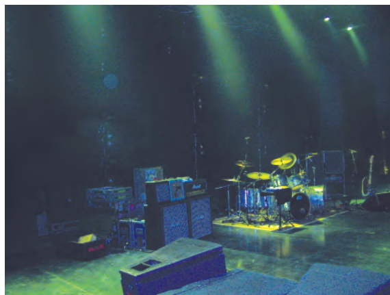
Сцена перед концертом