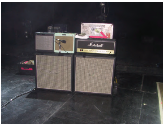
Гитарные усилители Джеффа Бекка на сцене

- Я ставлю Sennheiser прямо к динамику комбоусилителя.